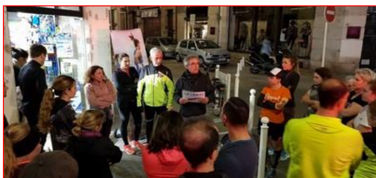
Présentation devant le magasin au 7 bis rue Berthelot – 83000 Toulon

>> En savoir + sur Terre de Running Toulon et TDR sur FB