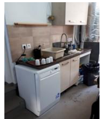
L'actuelle cuisine d'ARCHAOS

Couvertures – Duvets – Tentes – Baskets – Réchauds – Jeans – Polaires – Blousons – Chaussettes – Sous-vêtements.