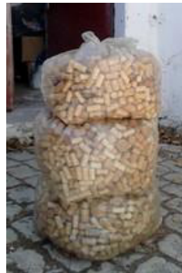
Collecte du LIEN depuis Février 2017

Nous continuons à collecter les bouchons de liège pour France Cancer. Revendus 300 € la tonne pour la fabrication d'isolants, ces 4 dernières années, France Cancer a pu remettre 100 000 euros aux chercheurs du CNRS et de l'INSERM de Nice.