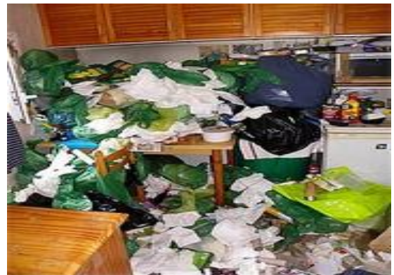
Logement d'une personne souffrant du syndrome

Le syndrome de Diogène est un dérèglement du comportement chez la personne. Il se traduit par une absence totale d'hygiène personnelle et un trouble obsessionnel compulsif qui conduit à amasser ou à ne pas jeter un grand nombre d'objets inutiles voire de déchets. >> En savoir +